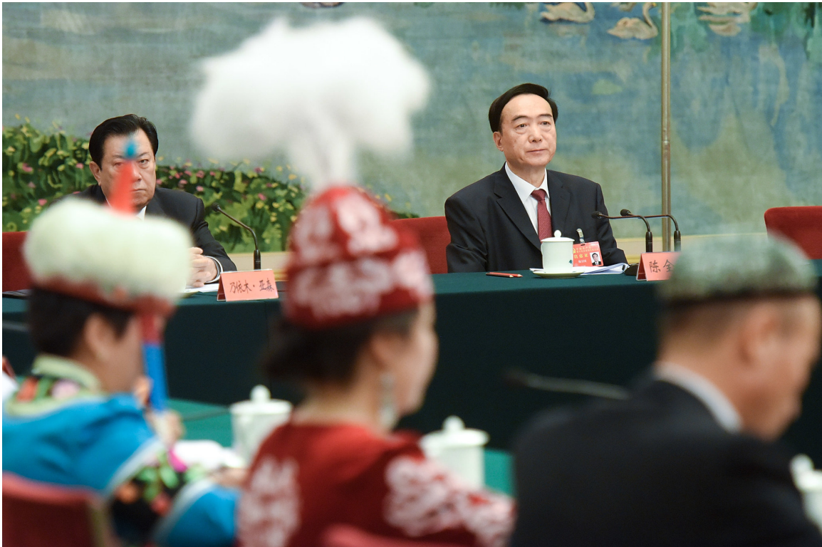
陈全国(右)在来到新疆之前担任西藏党委书记。

陈全国发布了一条影响广泛的命令：「应收尽收。」这个模糊说法自2017年开始，不断出现在内部文件中。