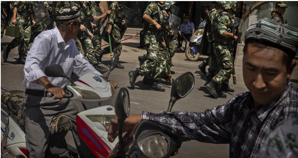
2014年，安全部队保卫了喀什市清真寺外的一个区域。