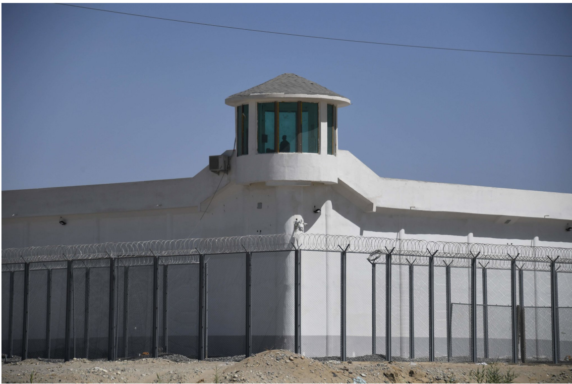
在中国和田郊区的一个被认为是拘禁营地附近的一个高安全设施。