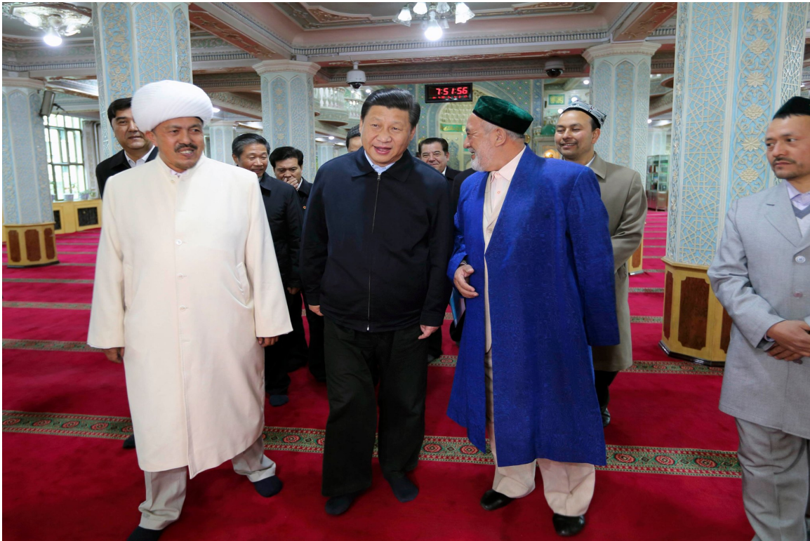
2014 年，习近平主席参观了乌鲁木齐市一座清真寺。

报告提到，孩子看到他们的父母被带走，学生想知道谁来支付他们的学费，由于缺乏劳动力，农作物无法种植或收割。然而，官员们接到的指示是，告诉那些抱怨的人，要感谢共产党的帮助，保持沉默。