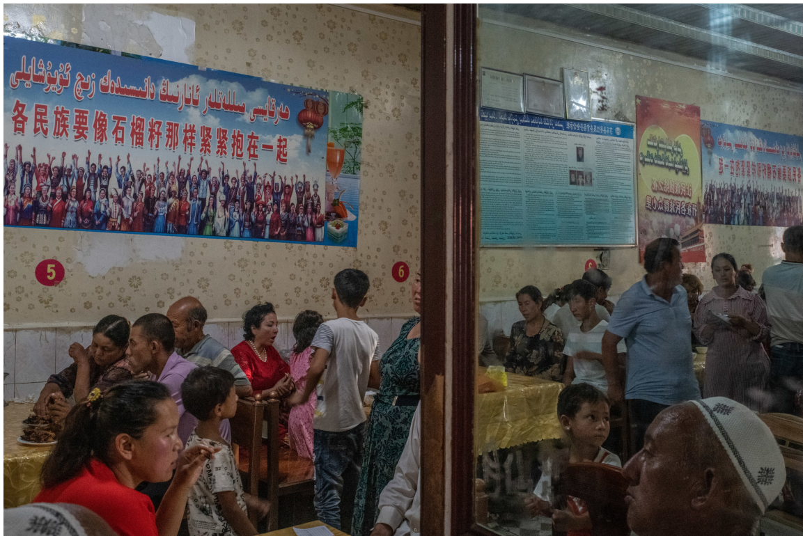
八月份，在旧城亚尔甘 (Yarkand) 的一家餐馆里，宣传海报引述习近平的话：「各民族要像石榴籽那样紧紧抱在一起。」

中国领导人对政策制定严格保密，尤其是涉及新疆地区时。新疆资源丰富，是一个与巴基斯坦、阿富汗和中亚国家接壤的敏感边疆地区。主要是穆斯林的少数民族占新疆 2500 万人口的一半以上。这些少数民族中最大的群体是维吾尔族，他们说一种突厥语系语言，长期以来一直在文化和宗教活动上受歧视、受限制。