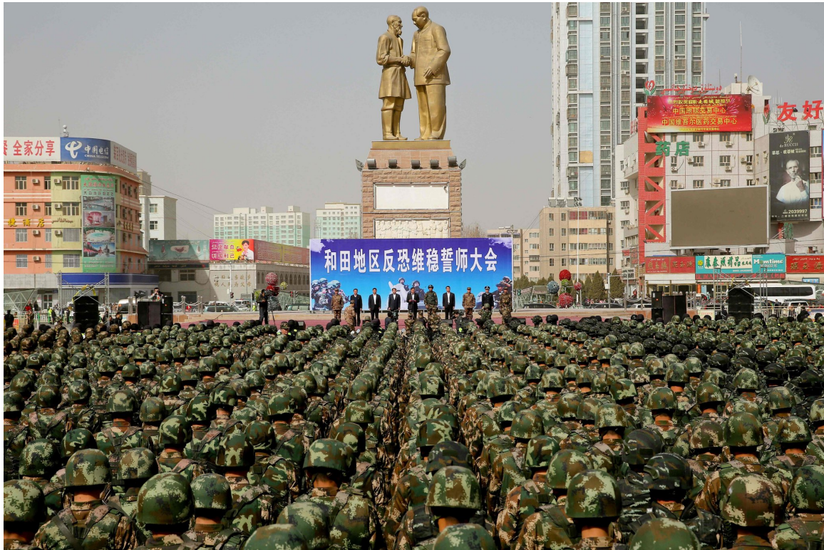
中国军警 2017 年在和田集会。

他把党员召集到一个公共广场开大会，敦促他们抓紧打击恐怖分子的工作。「坚决打干净，打彻底，」他说。「斩草除根。」